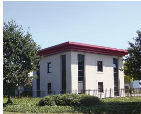
Hoofdkantoor en uitvaartcentrum in Geldrop

Nu u nog volop in het leven staat, is uw eigen uitvaart wellicht het laatste onderwerp waarmee u zich bezig houdt. Het moment waarop wij afscheid van het leven moeten nemen is voor een ieder van ons onbekend en komt veelal onverwacht. Daarom is het misschien goed om toch eens een keer over het levenseinde na te denken en over alle zaken die na een overlijden geregeld moeten worden. Het is ook verstandig om stil te staan bij de kosten die een uitvaart met zich meebrengt. Deze kosten zijn afhankelijk van uw keuze voor begraven of cremieren en uw verdere persoonlijke wensen. U kunt immers een uitvaart kiezen die bij uw geloofsovertuiging en manier van leven past. Voor het vastleggen van alle wensen voor uw eigen uitvaart, stellen wij het document "Mijn Uitvaartwensen" ter beschikking.